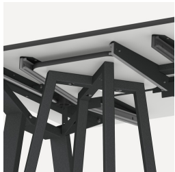
Halterung für FLEXLAB Hocker und Tidy Boxen