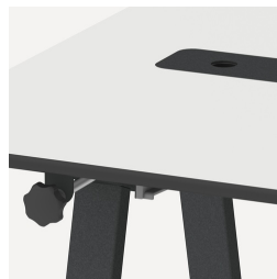
Multifunktional durch verschiedene Ausstattungsmöglichkeiten