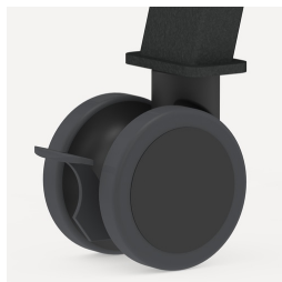
Vier große Doppelaufrollen jeweils mit Feststellbremse