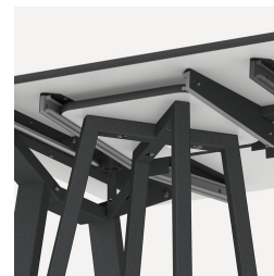
Halterung für FLEXLAB Hocker und Tidy Boxen