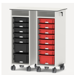
Zusätzliche Arbeitsfläche durch Aufsatzplatte