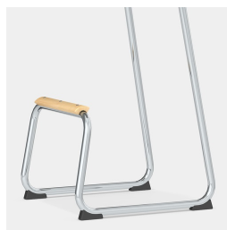
Cadre robuste pour les patins