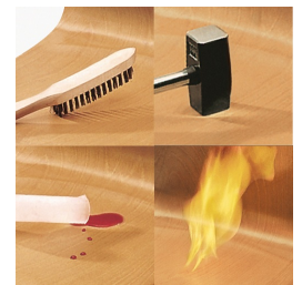
Coque indestructible en PAGHOLZ®, résistante aux rayures, aux chocs et aux flammes.