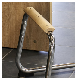
Repose-pieds laqué naturel