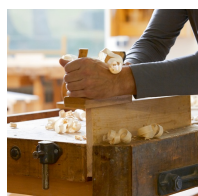
Bois de hêtre massif issu de la sylviculture durable avec vernis à base d'eau