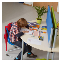
Idéal comme protection visuelle et acoustique