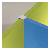
Assemblage de cloisons en T