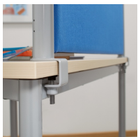
montage au moyen d'une vis à six pans creux sur le plateau de la table