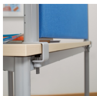
montage au moyen d'une vis à six pans creux sur le plateau de la table