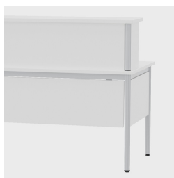
Aspect élégant : pied de table continu

Vous trouverez notre gamme de matériaux et de couleurs dans l'aperçu des matériaux ASS.