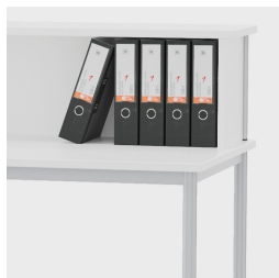
Suffisamment haut et profond pour accueillir des classeurs courants