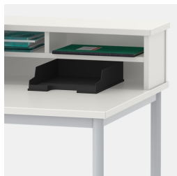
Le casier de rangement met de l'ordre et permet de garder une vue d'ensemble