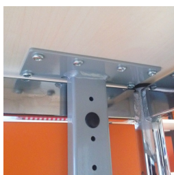
Vissé solidement au plateau de table

Vous trouverez notre gamme de matériaux et de couleurs dans l'aperçu des matériaux ASS.