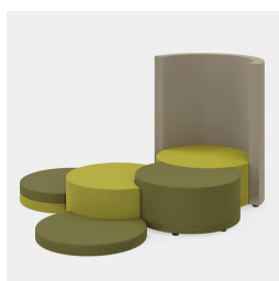
Multiples possibilités de combinaison des séries COCOON et JOYN