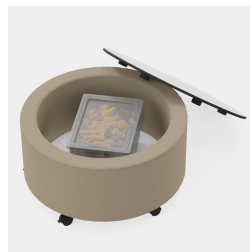
Table JOYN avec espace de rangement, par ex. boîtes Tidy avec couvercle