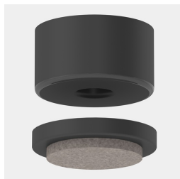
En option, protections de sol en feutre avec insert interchangeable