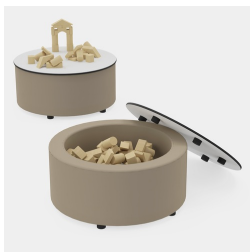
JOYN Table avec plateau amovible