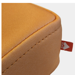
Couture rabattue de haute qualité