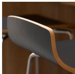
Coque robuste en hêtre multicouche avec revêtement CPL résistant aux rayures