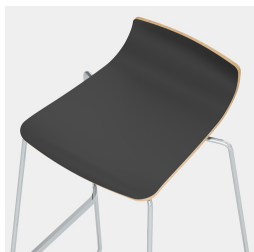
Fixation invisible de la coque du siège