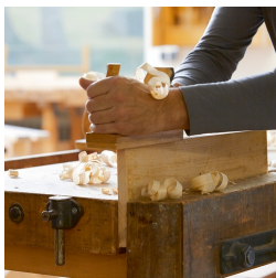
Bois de hêtre massif issu de la sylviculture durable avec verniss à base d'eau