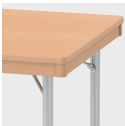
En option avec huisserie en bois massif en retrait