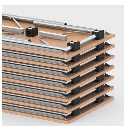
Jusqu'à 16 tables empilables