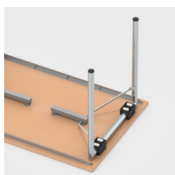
Pieds de table faciles à replier