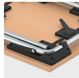
les protections d'empilage protègent le plateau de table des rayures