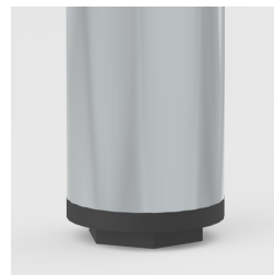
Protection de sol avec compensation de niveau : compense les inégalités du sol