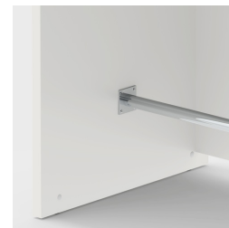
Repose-pieds inclus pour poser confortablement les pieds