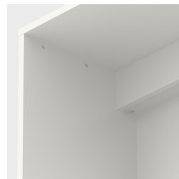
Avec passage de câbles intégré, à l'arrière