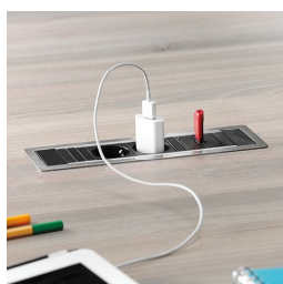
En option, deux prises de courant avec port USB ou connexion réseau : à gauche et à droite