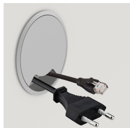
Passage de câbles latéral en option