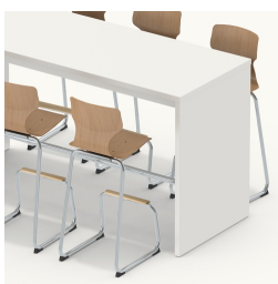
Possibilité de s'asseoir des deux côtés