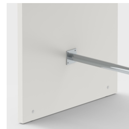
Repose-pieds inclus pour poser confortablement les pieds