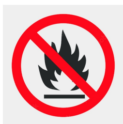
matériau du panneau support difficilement inflammable selon la norme DIN 4102 B1