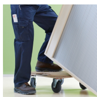
corps solidement chevillé et collé en usine