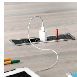
En option, deux prises d'étage avec port USB ou connexion réseau : au centre