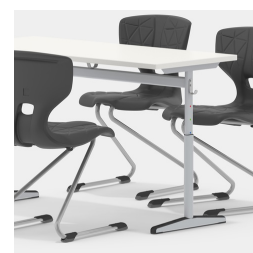
Sièges des deux côtés grâce au cadre de la colonne centrale