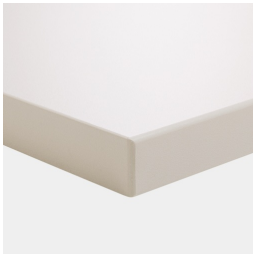
Plateau de table mélaminé avec bord en plastique robuste