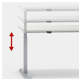
Réglage en continu et silencieux de la hauteur entre 62 et 127 cm