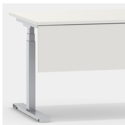
Accessoires adaptés : panneau frontal modèle 2050.202 et panneau latéral modèle 2050.162