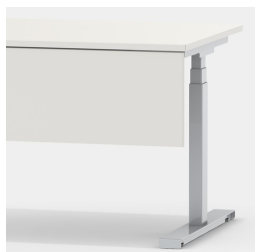
Accessoire adapté : panneau frontal modèle 2050.202