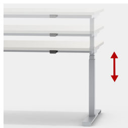
Réglage en continu et silencieux de la hauteur entre 62 et 127 cm