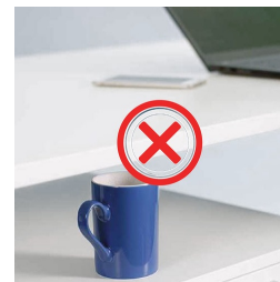
La protection anti-collision minimise le risque de dommages lors de la montée et de la descente