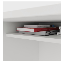
Incluant une étagère pratique