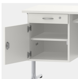
armoire basse avec tiroir, verrouillable au moyen d'une serrure de sécurité