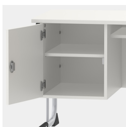
Unité de base, y compris une étagère, verrouillable au moyen d'une serrure de sécurité.