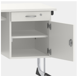
Unité de base incluant un tiroir, verrouillable au moyen d'une serrure de sécurité