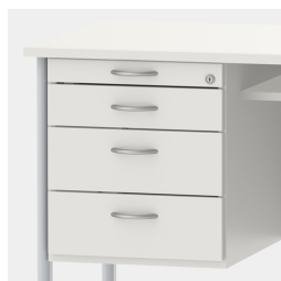
Unité de base comprenant un tiroir à ustensiles et des tiroirs avec mécanisme de fermeture souple et verrouillage central