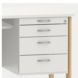
Unité de base comprenant un tiroir à ustensiles et des tiroirs avec mécanisme de fermeture souple et verrouillage central