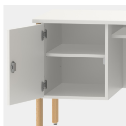
Unité de base comprenant une étagère, verrouillable au moyen d'une serrure de sécurité.