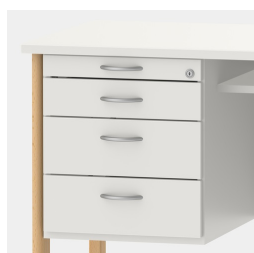
Unité de base comprenant un tiroir à ustensiles et des tiroirs avec mécanisme de fermeture souple et verrouillage central