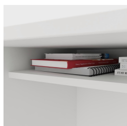
Incluant une étagère pratique