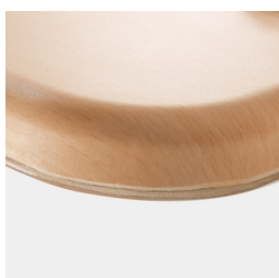
Plateau de table WOODMARK en qualité incassable (en option)