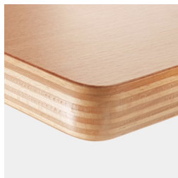
Option : plateau multiplex revêtu de mélamine