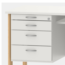
Unité de base comprenant un tiroir à ustensiles et des tiroirs avec mécanisme de fermeture souple et verrouillage central