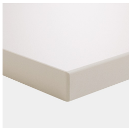
Plateau de table mélaminé avec bord en plastique robuste