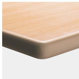
Plateau de table mélaminé en option avec bord ASSODUR®.