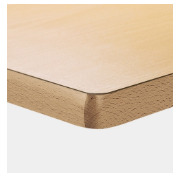
En option, plateau de table mélaminé avec bord en bois massif