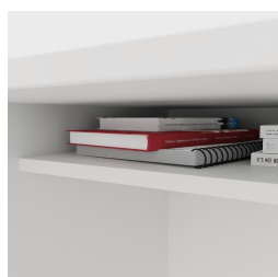
Incluant une étagère pratique