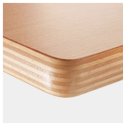
Option : plateau multiplex revêtu de mélamine