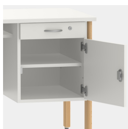
Unité de base incluant un tiroir, verrouillable au moyen d'une serrure de sécurité