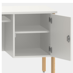
Unité de base comprenant une étagère, verrouillable au moyen d'une serrure de sécurité.