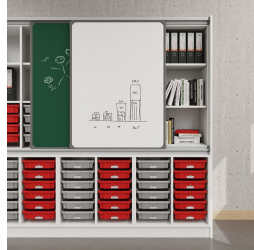
Tableau coulissant avec rails de guidage en aluminium et espace de rangement supplémentaire derrière les tableaux

matériau du plateau en mélaminé avec chants robustes en plastique