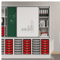
Tableau coulissant avec rails de guidage en aluminium et espace de rangement supplémentaire derrière les tableaux

Etagère surélevée avec Tidy Boxes derrière les panneaux