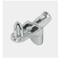
Supports d'étagères résistants à l'arrachement