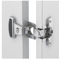
Paumelles métalliques à boîtier avec angle d'ouverture de 240