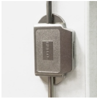
Barre de verrouillage de haute qualité