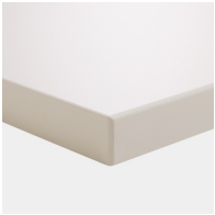
matériau du plateau en mélaminé avec chants robustes en plastique