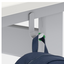
Comprend un crochet pour dossier par siège