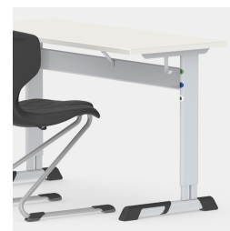
La forme en C permet de ne pas gêner les pieds de la table lors de la montée et de la descente de celle-ci.