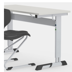
La forme en C permet de ne pas gêner les pieds de la table lors de la montée et de la descente de celle-ci.