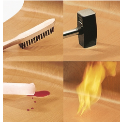
Tableau PAGHOLZ® indestructible, résistant aux rayures, à la rupture et aux chocs, et ignifuge.