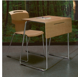
Section transversale filigrane et design moderne