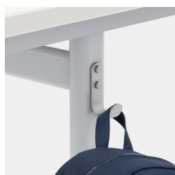
Comprend un crochet pour dossier par siège