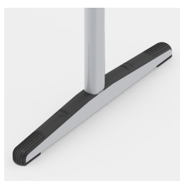
Protecteurs de sol avec protection continue des marches