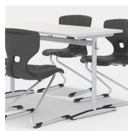
Sièges des deux côtés grâce au cadre de la colonne centrale