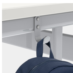
Comprend un crochet pour dossier par siège