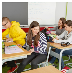
La forme en C permet de ne pas gêner les pieds de la table lors de la montée et de la descente de celle-ci.