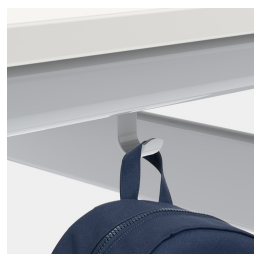
Comprend un crochet pour dossier par siège