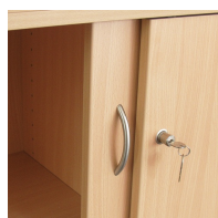
Portes coulissantes lissés