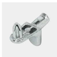
Supports d'étagères résistants à l'arrachement